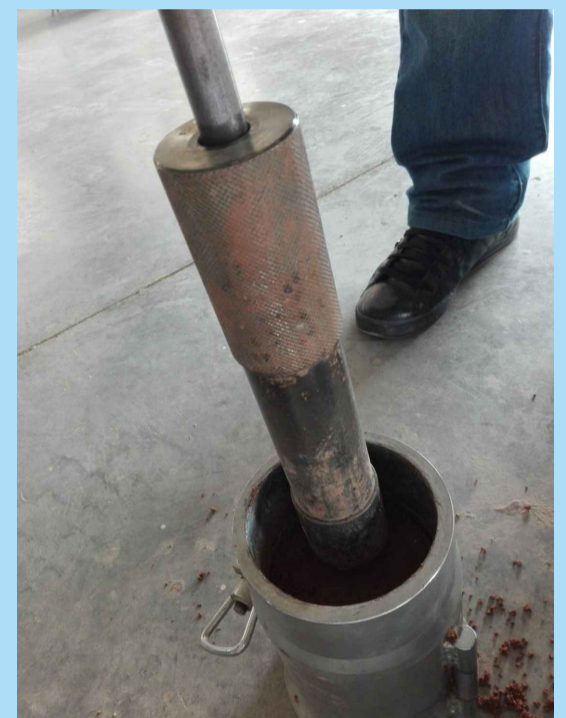
Maza metálica para el ensayo PN