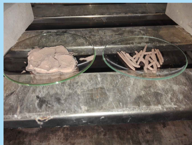
Muestra final de los Límites de Atterberg