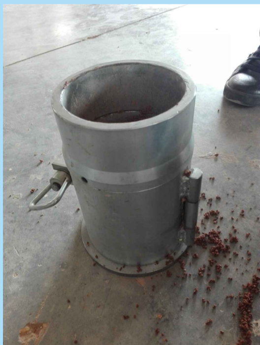
Molde cilíndrico para el ensayo PN