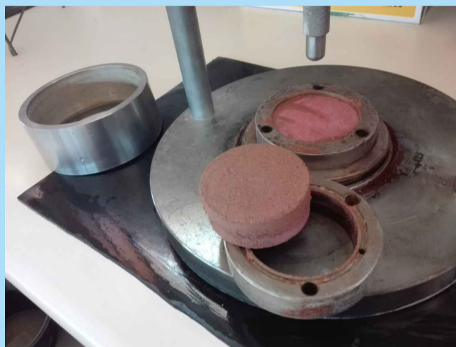
Marco metálico y célula del ensayo Lambe

ENSAYOS REALIZADOS: -Análisis Granulométrico. -Límites de Atterberg. -Próctor Normal (PN). -Ensayo Lambe.