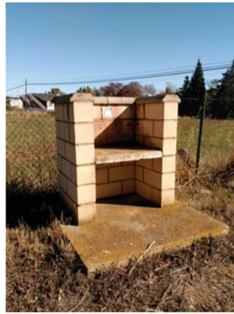
Conjuntos barbacoas sin cubrición